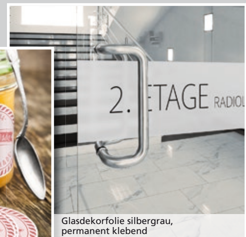
Glasdekorfolie silbergrau, permanent klebend