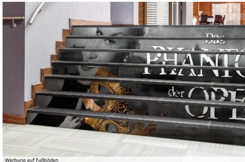
Werbung auf Fußböden