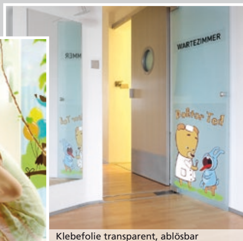
Klebefolie transparent, ablösbar