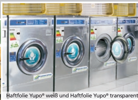
Haftfolie Yupo® weiß und Haftfolie Yupo® transparent