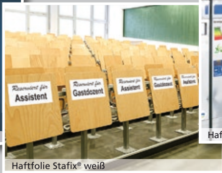
Haftfolie Stafix® weiß