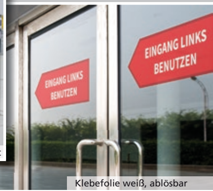
Klebefolie weiß, ablösbar