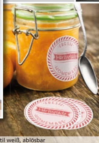
Klebefolie Textil weiß, ablösbar