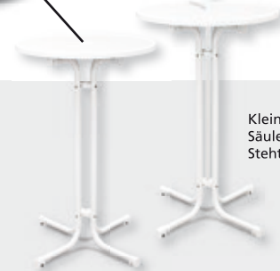
Kleinschirm mit Säulenklapp-Stehtisch