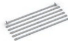
Fahnenschlingen-Set, ø 100 mm

Alle Maße sind circa Angaben. Da wir ständig an der Weiterentwicklung unserer Produkte arbeiten, müssen wir uns technische Änderungen sowie Toleranzen vorbehalten.