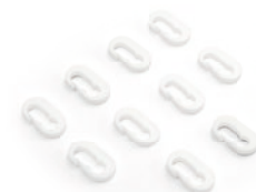
Depothaken, 10er-Set als Zubehör optional erhältlich